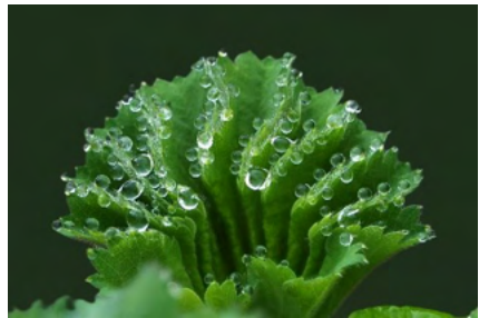
Guttatiedruppels op planten

Plantenwortels nemen vocht en mineralen uit de bodem op om te groeien. Voor een goed evenwicht wordt vocht via huidmondjes die onderaan het blad zitten verdampt. Soms is er teveel vocht en kan er niet voldoende via de poriën worden verdampt. Het overtollige vocht wordt aan het einde van de bladnerven uitgescheiden. Precies op de topjes.