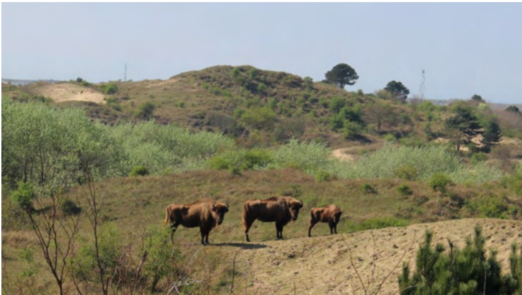
Wisentkoeien met kalf in nationaal park Zuid-Kennemerland 2014

Wisenten worden ook wel de Europese bizens genoemd en zijn de grootste, levende landzoogdieren van Europa. Nog niet zo lang geleden waren ze bijna uitgestorven, maar sinds 2007 leeft er een kudde Wisenten in het Kraansvlak, een afgesloten deel van Nationaal Park Zuid-Kennemerland. In 2007 zijn de eerste drie dieren aangekomen vanuit Białowieża Forest in Polen. De volgende drie arriveerden een jaar later, twee koeien waarvan één met kalf. Met deze zes Poolse dieren begon het. In de duinen vinden deze dieren voldoende voedsel. Het zijn herkauwers, die zowel gras eten als kruiden, knoppen, blaadjes, jonge twijgen en bast. Zelfs takken en stammen buigen ze af van de bomen en struiken. Of ze schrapen soms grond weg om bij de voedzame delen te komen. Het kalfje van toentertijd heeft zelf weer 8 kalfjes gekregen, waarvan er nog één in Kraansvlak leeft en inmiddels tot de wijzere koeien behoort. Drie zijn er overleden en vier zijn er geëxporteerd naar de Maashorst en naar Spanje.