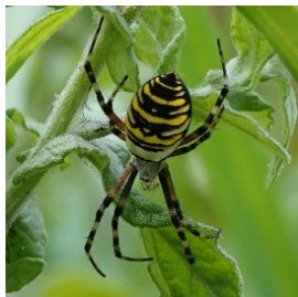
Wesp spin horizontaal en verticaal gestreept

volop en het was windstil. Toch hoorde ik iets ritselen in de begroeiing. Na goed kijken zag ik een grote sprinkhaan, het bleek de Grote groene sabelsprinkhaan te zijn, laag bij de grond in een rommelige struik.