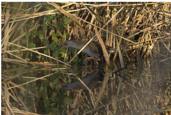
Peggy van Zoen

Waterrallen horen wij eerder dan dat wij ze zien, ze zijn makkelijk te herkennen door hun gegil, dat klinkt als van een speenvarken. Echter de laatste tijd is er een ex. te zien in het riet langs het Kroftwegje in Sassenheim, blijkbaar is het daar goed toeven (PVZ)!