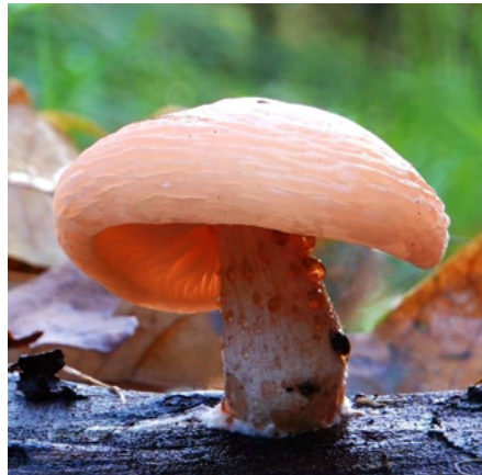
Guttatie op een jonge Zalmzwam

De natuur is altijd verrassend en soms een kunstwerk.