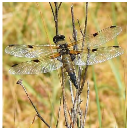
Bloedrode heidelib en Viervlek