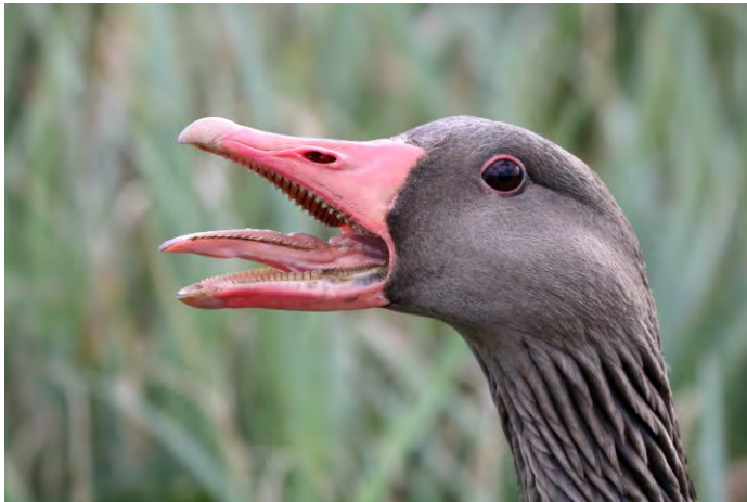
Grauwe Gans (Jos den Boer)

Op 9 en 10 februari hangen er twee Raven rond in de omgeving van Sassenheim en Warmond. Op 9 februari vliegen twee vogels in zuidelijke richting over de Floris Schouten Vrouwenpolder Zuid in Sassenheim, de volgende dag vliegen ze in noordelijke richting over de Oude Vuilnisbelt (VWA). Een roepende Grote Barmsijs is op 19 februari te horen in de Mennepark te Sassenheim (HVS). Hier op 23 februari is er een roepende Kruisbek te horen (HVS).