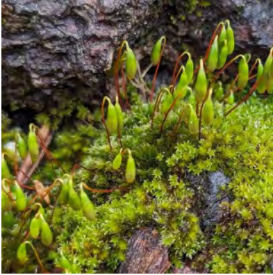
Gedraaid knikmos maakt groene tot roodbruine zoden. Het blad is langwerpig. De kapsels hangen aan gebogen steeltjes.