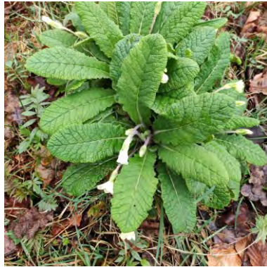
Vingerhelmbloem en Stengelloze sleutelbloem

Het woord stinzenplant komt van het Friese woord 'stins', dat 'stenen huis' betekent. Het gaat veelal om ingevoerde sierplanten die zich konden handhaven of verwilderd zijn. Het aanplanten van stinzenplanten kreeg aan het einde van de 18 e eeuw een impuls door de opkomst van de 'Engelse tuin'. Het ideaal van deze tuinarchitectuur was de natuurlijke schoonheid die men wilde perfectioneren door planten uit te zetten ter verwildering. Kennelijk waren de landschapsarchi-