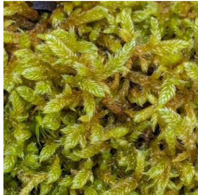
Gesnaveld klauwtjesmos maakt glanzend groene tot goudbruine matten. De stengel is onregelmatig geveerd vertakt. De bladuiteinden zijn sikkelvormig.