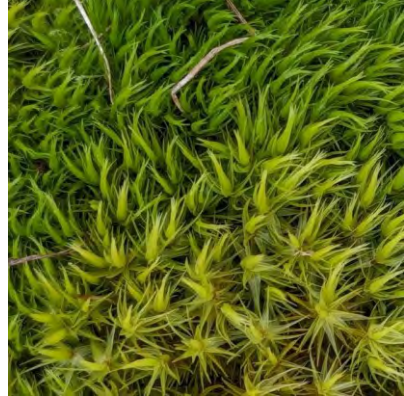
Gewoon gaffeltandmos maakt geelgroene tot donkergroene zoden. Het blad is lang met een smalle punt. De kapselsteel is recht.