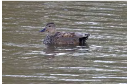
Tafeleend en Krakeend

We liepen door richting het noordelijk gedeelte van de polderplassen, en de gruttoroep kwam ons al van verre tegemoet. Het is meer 'utto utto' dan 'grutto grutto' maar met goede wil hoor je toch echt dat de vogelnaam een onomatopée is.