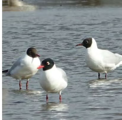
Zwartkopmeeuwen (Annelies Moolenaar)

Op 2 april vliegen er vier Zwartkopmeeuwen over de Oude Vuilnisbelt te Sassenheim (JWI).