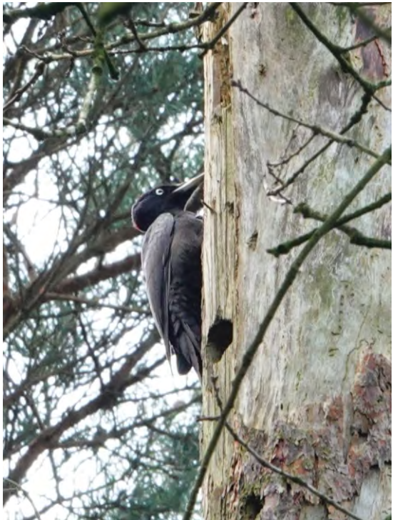
Zwarte Specht