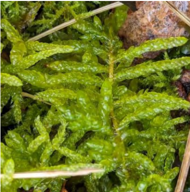
Groot laddermos vormt losse zoden. Het heeft een lange stengel, de vertakking is geveerd en de zijtakken liggen redelijk plat, waardoor ze als het ware een laddertje vormen.