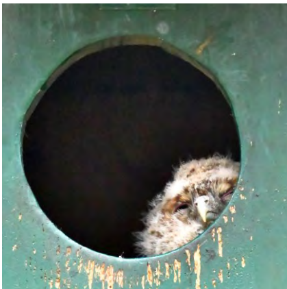
Jonge Bosuil (Sjaak Weijers)

Drie jonge Bosuilen ('takkelingen') zijn samen met een ouder op 22 april ter plaatse in het bos van Klein Leeuwenhorst te Noordwijkerhout (WNL).