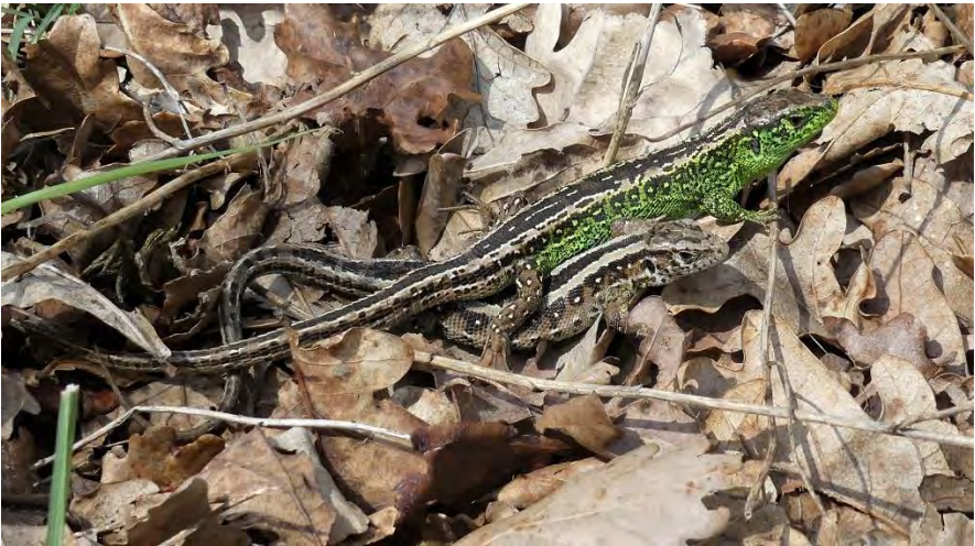
Zandhagedissen (Adrie van Dam)

Het duingebied is o.a. het leefgebied van de Zandhagedis die ook wel Duinhagedis wordt genoemd. De meeste hagedissen zijn bruin, maar het mannetje van de Zandhagedis heeft een opvallende kleur. Toch zie je ze niet zomaar en je hebt geluk als je er een ziet. En je hebt dubbel geluk als je er zelfs drie ziet.