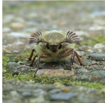
Meikever – antennes met lamellen (Adrie van Dam)

Eerst maar iets meer over dit drietal. Deze kevers behoren tot de Bladsprietkevers ( Scarabaeidae ) en deze naam verwijst naar de bladsprieten, de antennes die ook wel tasters of voelsprieten genoemd worden. De verdikking aan het uiteinde van de antennes eindigt in een aantal lamellen die reuksensoren bevatten en waarmee de mannetjes de vrouwtjes op de geur kunnen vinden. Het belangrijkste in een keverleven is tenslotte de voortplanting.