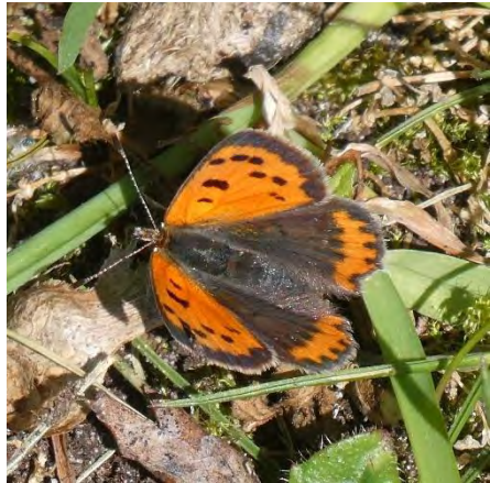
Paartje Icarusblauwtje en Kleine vuurvlinder (Maud van der Veen)