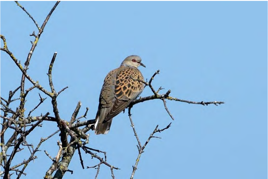
Zomertortel (Annelies Moolenaar)

Deze lente maakte ik een wandeling bij Kwade Hoek, Goedereede. Bij de parkeerplaats al hoorde ik het weldadig zacht koerende geluid. Heerlijk! Meerdere Zomertortels hadden er hun territorium, dus een wandeling daar is bijna nostalgie. Zo fijn dit prachtige duifje weer eens te zien! Hopelijk komen er nog weer eens betere tijden voor deze prachtige zomervogel!