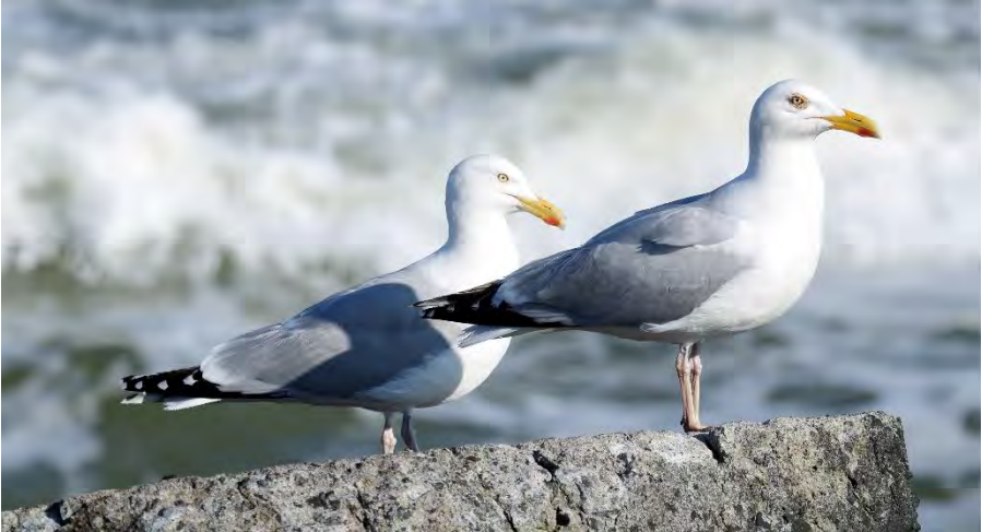
Zilvermeeuw (Jos den Boer)

Onderweg zagen wij een groep van vier Steenlopers die druk aan het foerageren waren boven op een met mossen en wieren bedekt rotsblok. Ik zocht naar een Paarse Strandloper alhoewel het niet de juiste tijd van het jaar voor deze soort is op de pier. De laatste waarneming was van 18 mei en dat is al heel laat!