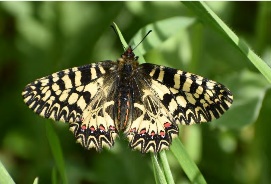
Zuidelijke Pijpbloemvlinder (Paul Venderbosch)

Ging het mij dan alleen om de vogels? Nee, wie mij een beetje kent weet dat ik eigenlijk wel een generalist ben. Alles vind ik mooi in de natuur. Dat heeft het geluk dat ik ondanks het gegeven dat ik veel vogels heb gemist, heel veel andere mooie dingen heb gezien. Zo heb ik veel vlinders gezien. Ook nieuwe soorten, zoals de Zuidelijke Pijpbloemvlinder.