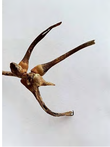
Ramshoorngal: vers exemplaar en een verhout exemplaar (Joop Kortselius)

De gal bestaat uit een bol deel waarin de larve leeft en een opvallend uitgroeiisel waaraan de gal haar naam ontleent. Ook de deftige naam Andricus aries verwijst hiernaar: het sterrenbeeld Ram wordt Aries genoemd. Later in juli en augustus zie ik tientallen Ramshoorngallen, nu nog fris groen van kleur en nog niet verhout. Hoe leven ze? En waar komen ze vandaan?