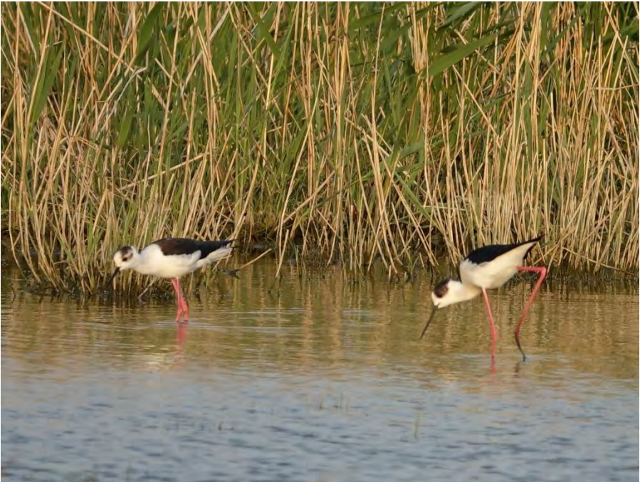
Stelkluut (Annelies Moolenaar archief)

Als we van huis gaan is het 15 graden en de zon schijnt. Om 20.00 uur toen iedereen aanwezig was gingen we met 16 enthousiaste mensen op pad. Het aantal deelnemers was niet te groot om met elkaar als groep te lopen. Wat ik mij van een aantal jaren geleden herinnerde was dat het waterrijke gebied met erg veel vogels erg vergrast is. We konden over gemaaide paden lopen tussen de mooie grassoorten met lange en bloeiende aren en hoorden gelijk al de Fitis luid zingen. Jan noemt de planten op zoals Waterzuring, Grote brandnetel, Speerdistel, Fluitenkruid, Zuring en de Vlier en alles staat mooi in bloei. De vogels zijn nog lekker wakker en laten zich zien en horen zoals de Boerenzwaluw. Adrie ziet een Fazant en zet hem op de foto; daarna door het hek heen nog een andere Fazant. Een zwerm Gierzwaluwen trekt over.