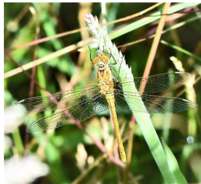
Bosmeikever en Zuidelijke heidelibel (Sjaak Weijers)