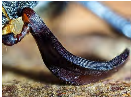
De Julikever opent zijn lamellen aan de voelsprietten niet (rechts 7x vergroot)