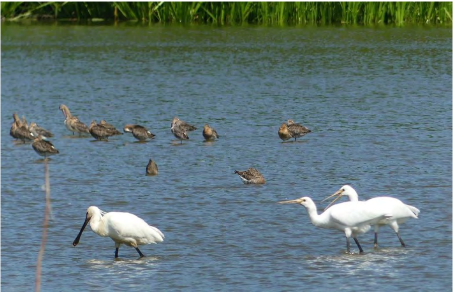
Lepelaars (Sarah Humphrey)

Als laatste gebied reden we naar de Klaas Hennepoelpolder. Via een klein weggetje onder het spoor pakten we de noordelijke ingang. Dit gebiedje is in 2007 ontstaan als compensatie voor de nieuwe woonwijk Poelgeest. Het is een plas-dras gebiedje, waar veel vogels foerageren en leven. Het gebied is bekend door Molen 't Poeltje, een molen uit 1789, die tot 1925 in functie was. Ook hier liepen we een klein rondje. De temperatuur was inmiddels nog meer gestegen, dus was het even puffen. Maar dat was de moeite waard, want midden in een poel liepen vijf Lepe-laars. Ouders met kinderen, die les kregen in het oplepelen van voedsel uit het water.