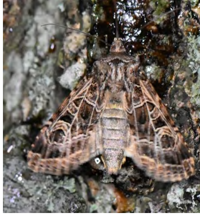
Wondklaver en Gelijnde silene-uil (Sjaak Weijers)

Ondertussen ziet het gebied er natuurlijk ook anders uit. De open velden staat vol met allerlei soorten grassen en veldbloemen. De vlinders en bijen genieten daar enorm van. De diverse poelen worden omzoomd door riet, waar de libellen en waterjuffers van profiteren.