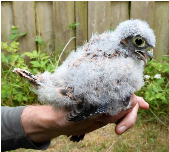
Jonge Torenvalk (Sjaak Weijers)

Op 3 juli was het zover, de jongen werden voorzichtig uit de kast gehaald en daarna een voor een gemeten, gewogen en geringd. Door de meetuitslagen weten we dat het 2 mannen en 2 vrouwen zijn. De ouders hebben we, hoe vreemd ook, op dat moment niet gehoord of gezien. Na ongeveer 2 weken na het ringen zijn ze uitgevlogen en ik heb ze niet meer gezien. Al met al weer een leuke ervaring en ik hoop dat ik er volgend jaar weer bij kan zijn.