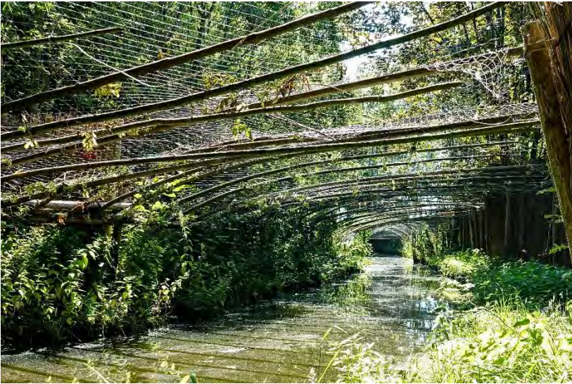
Eendenkooi Warmond (Marjo 't Jong-Montijn)

Door de spleten in het kooihuisje kun je de vogels in de plas goed zien en worden ze geobserveerd voor onderzoeksdoeleinden. In de kooikerplas staan ook palen met daaraan broedkorven. De vorm van de broedkorven en hoe deze geplaatst zijn zorgt ervoor dat de jonkies veilig beneden zitten en er niet uit kunnen vallen. Ook zijn ze mooi aan het oog onttrokken voor Zwarte Kraaien en Eksters.