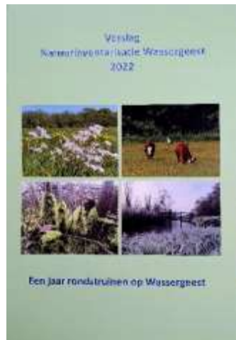
Van het gele boekje naar het groene boek