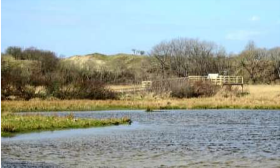
Lentevreugd (Lidy van der Salm)

Het gebied wordt zoveel mogelijk opengehouden met hier en daar wat lage vegetatie. Er staan ook veel Elzen en Populieren afgewisseld met Duindoorn. Ook de Braam doet het de laatste jaren te goed. Verder is het een weids gebied, dat een verbinding vormt tussen de Duinen en de Polders.