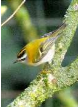
Vuurgoudhaan (Sjaak Weijers)

Bijzondere waarnemingen bij de vogels waren de Vuurgoudhaantjes, de Fluiter en de Kleine Bonte Specht. Maar ook de overvliegende Bonte Kraai en Flamingo's vielen op. Bij de planten werden Armbloemige look, Grote veldbies, Veldhondstong en een Vroege sterhyacint gesignaleerd. Bij de mossen en korstmossen vielen het Beukenvlekje, Waaiertakmos, Dwergwratjesmos en Witkopvingermos op. En bij de paddenstoelen de Eikentrilzwamgal, het Grijswit houtschijfje en de Populierenvuurzwam.