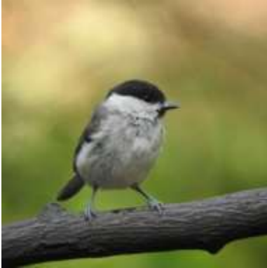
Glanskop (Annelies Moolenaar)

We kijken (met onze verrekijker) over een langstuk land uit op een tiental grijs-witte houten paaltjes. Op 1 paaltje na, waren alle paaltjes van boven af recht afgesneden. Het ene paaltje werd versierd met eenzelfde kleur bolletje en klein zwart dopje bovenop. Het Glanskopje bovenop het paaltje!