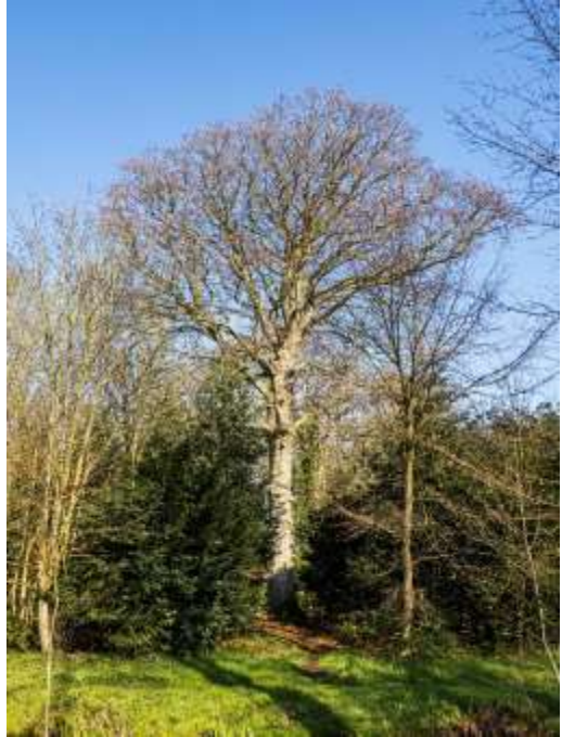
160 jaar oude Beuk (Jan Bischoff Tulleken)

Een enorme Beuk met een leeftijd van minstens 160 jaar, met bovenin diverse Houtduiven, werd veelvuldig gefotografeerd. Daarna was het tijd voor details op de grond liggende takjes: Esdoornhoutknotszwam en Kraterkorstkoegelzwam die alleen met loepjes zichtbaar zijn. Zo ook het Brandnetelvulkaantje op een overjarige Brandnetelstengel. Daarna volgde het Armbloemig look en vlak bij een waterpartij bloeiende Pinksterbloem, een enkel Klein hoefblad, Japans hoefblad en in het water de contouren van de Gele lis. Op een dode Beuk met Hedera er omheen zagen we Zilveren boompuist (= een slijmzwam).