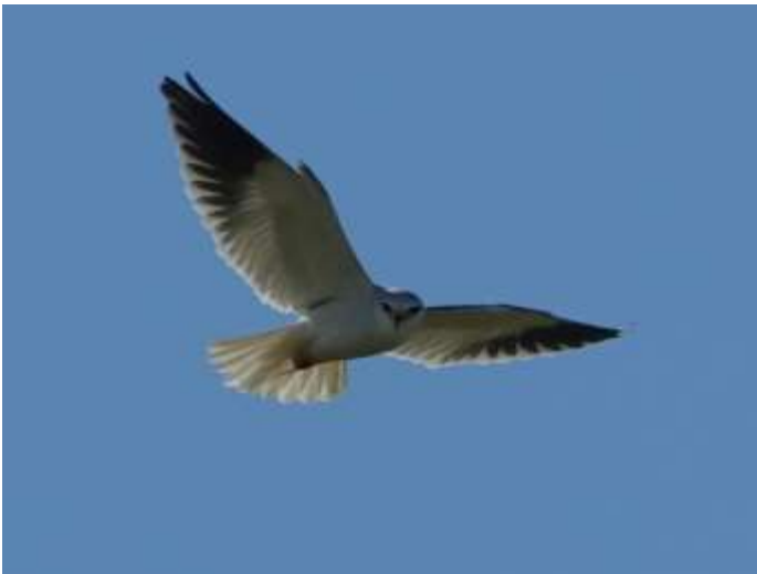
Grijze Wouw (Annelies Moolenaar)

De Grijze Wouw ( Elanus caeruleus ) komt onder andere voor in Afrika ten zuiden van de Sahara. Vanuit Afrika rukt de vogel geleidelijk op naar Europa, en wordt in Nederland af en toe gezien. Hij jaagt vooral op kleine zoogdieren en reptielen.