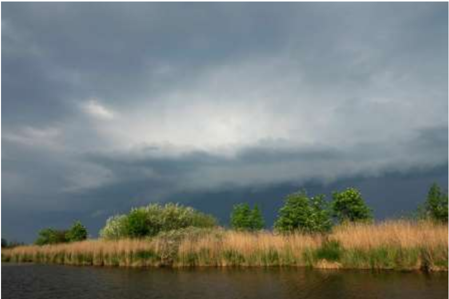
Dreigende wolken boven de Nieuwkoopse plassen (Otto Thomas)