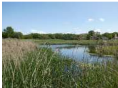
Natuurgebied Langeveld voorjaar 2023 (Annelies Moolenaar en Maud van der Veen)

Vanaf 1 januari tot 15 mei hebben we inmiddels 750 soorten op naam gebracht en zijn er zijn zo'n 4700 waarnemingen ingevoerd. De eerste maanden van het jaar vormen de planten, mossen en korstmossen, paddenstoelen en vogels het grootste aandeel. De vogels zijn het vaakst ingevoerd. Er zijn inmiddels zo'n 100 andere waarnemers actief.