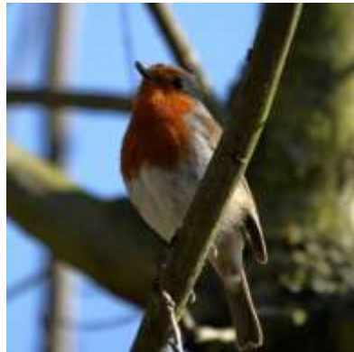
Merel en Roodborst (Jos de Boer)

Ik heb ontzettend genoten van de minicursus en vooral van jullie passie die jullie tentoonstellen tijdens de presentaties en wandelingen. Ik had er geen notie van dat er zoveel verschillende vogels en mooie plekken in de buurt te zien zijn, waarschijnlijk omdat ik er nooit de tijd voor genomen heb om het rustig te bekijken en te beluisteren.