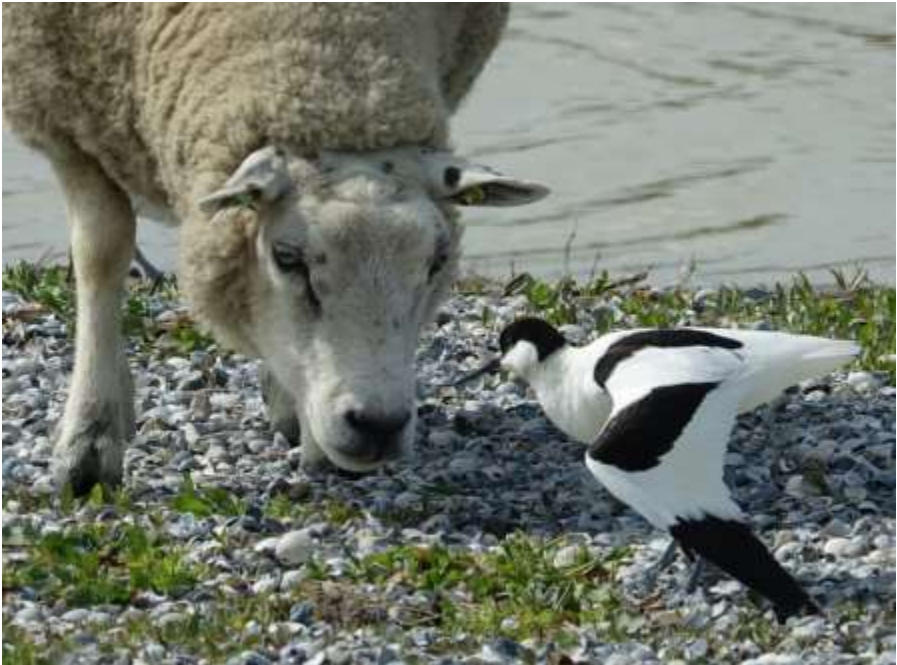
Klult met schaap (Annelies Moolenaar)

verder en de Kluten proberen steeds nieuwe trucs uit. Het kluten-toneelstukje is als een soap mooi in beeld gebracht.