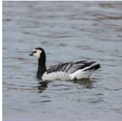
Blauwe Reiger en Brandgans (Roeland Mol)

Wat hebben mijn moeder en ik genoten van jullie enthousiasme voor de vogels. Van nu af aan is buiten lopen niet alleen meer kijken, maar is er luisteren bij gekomen. Maar daar moet nog wel veel geoefend worden, want wat is het moeilijk! en vooral leuk om te doen. Bedankt voor jullie leuke cursus!!!