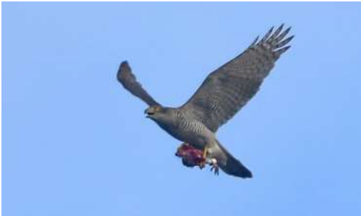
Havik met prooi (Sjaak Weijers)

Een mooi moment was een overvliegende Havik met prooi.