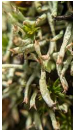
Varkenspoetje (Michiel Langeveld)