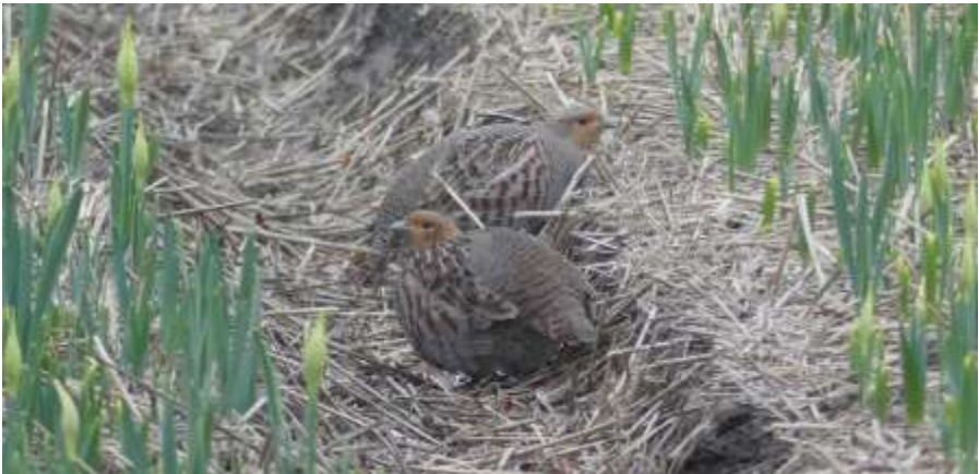
Patrijzen (Sarah Humprey)

Waarnemingen van Patrijzen komen van verschillende locaties in de Bollenstreek: Hillegom, Lisse, Noordwijkerhout en Voorhout. Er zijn geen grote groepen gezien, het gaat meestal over twee vogels bij elkaar (VWA). Op 5 maart zijn er twee Watterrallen te horen roepend bij het Oosterduinsemeer in Noordwijkerhout (CZU). De eerste 3 jonge Meerkoeten van de lente zijn op 30 april te zien in een sloot langs de Vinkenstraat in Noordwijkerhout (WNL).