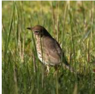
Zanglijster (Roeland Mol)