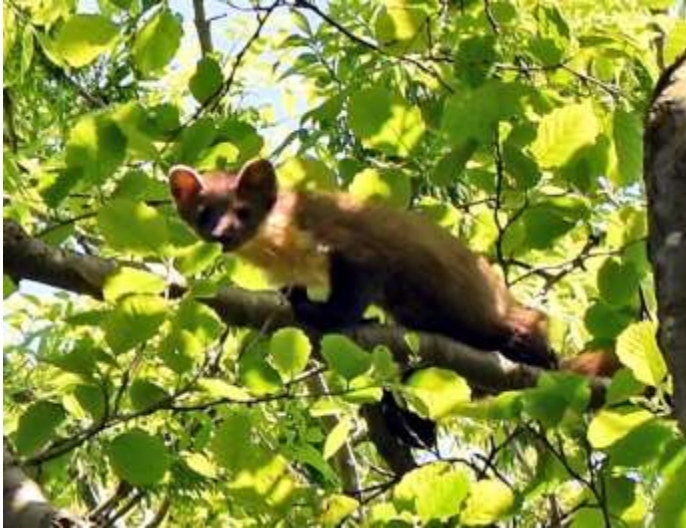
Boommarter (Sjaak Weijers)

gen 4 eieren in. Als het goed is komen er de komende dagen nog een paar bij, dan is het 35 dagen broeden en na 15 dagen worden de jongen geringd. Ook hebben we met de langestok en camera in het sperwernest gekeken. Tot onze verbazing was het nest bezet, maar niet door een Sperwer.