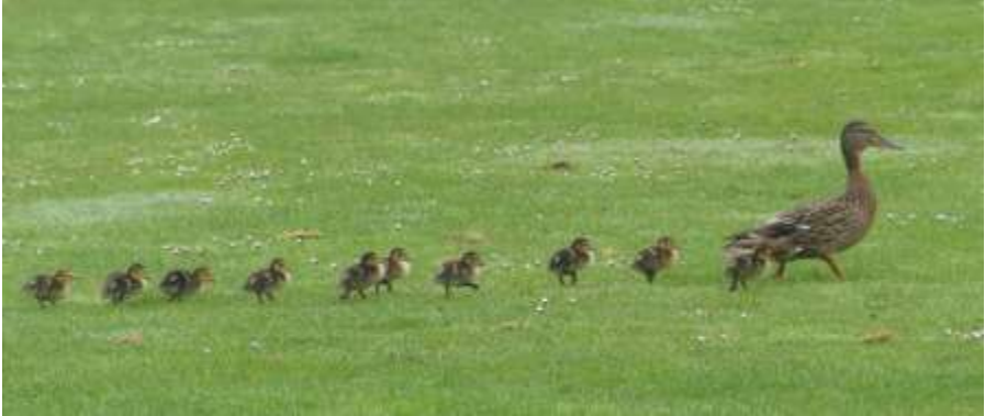
Wilde eend met kinderen (Sarah Humphrey)