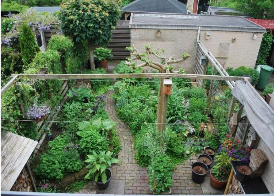
Groene tuin (John van Velzen)

Geadviseerd wordt daar als het even kan de tijd voor te nemen. Kijk eens goed rond bij anderen hoe zij dat hebben gedaan. Begin met het vaststellen van basisvoorzieningen. Denk daarbij aan het looppad van huis naar schuur (verhard of een halfverharding met grint, houtsnippers of split), waar vind ik schaduw in warme zomers en waar zit ik lekker in het zonnetje. Waar staan mijn afvalcontainers gecamoufleerd uit het zicht. En moet er tussen de burens wel over de hele lengte een schutting staan. Voorkeur heeft natuurlijk een heg. En groen én goed voor onze vogels. Laat de tuin daarna geleidelijk groeien. Doe eventueel grondonderzoek om te kijken welke planten het beste bij die grondsoort passen. Ben je zover dat je er bloemen en planten in kwijt wil, denk dan zeker na over de bloei- of bloesemhoogte. Zorg als de ruimte beschikbaar is voor bloemen en planten die afwisselend bloeien van februari t/m november. Op die wijze zorg je voor jaarrond kleur in de tuin en bied je veel insecten voldoende voeding. Heb je echt geen of weinig tijd voor tuinonderhoud kies dan voor struiken en heesters. Die vragen beduidend minder onderhoud en geven de tuin een aangenaam groen karakter. En bieden schuilplaats voor vele vogels en insecten. Ook belangrijk. Weet je het in het begin nog niet zo? Strooi wat zaaigoed, gemakkelijk en kleurrijk. Lees wel de gebruiksaanwijzing hoe