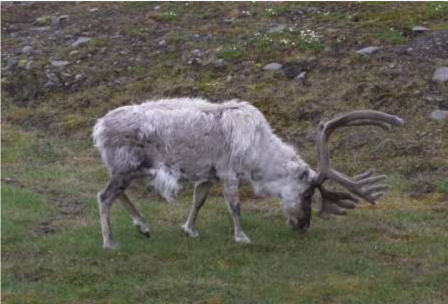
Rendier op Spitsbergen

De reis gaat eerst naar Spitsbergen. Op de foto's vallen de zwarte spitse toppen op van de bergen. De naam Spitsbergen is daarmee wel verklaard. We komen in het walvis-jachtgebied van de vroegere Hollanders. De Barentszee kennen we van Willem Barentsz en van Smerenburg waar gedurende zo'n 40 /50 jaar uit de Groenlandse walvissen traan werd gekookt. Later werd er door pelsjagers gejaagd voor het bont. Ook werden er kolen gedolven uit de mijnen. Nu is er, gebruikmakend van de lage temperatuur, een moderne zaadbank voor het bewaren van plantenzaden van over de hele wereld.