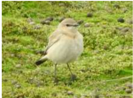
Izabeltapuit op Texel (Annelies Moolenaar) →

Aansluitend aan de AV zal er een fotopresentatie zijn door Annelies Moolenaar over vogels op Texel.