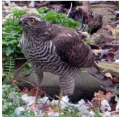
Sperwer (Cees Timmermans)

Met veel vleugelgeklap ging deze keer de rest van het karkas mee de lucht in en ze verdween over de schutting naar waarschijnlijk een wat rustiger plekje, zonder geïnteresseerde toeschouwers. Voor ons bleef er niets over als een flinke hoeveelheid losgeplukte veren.