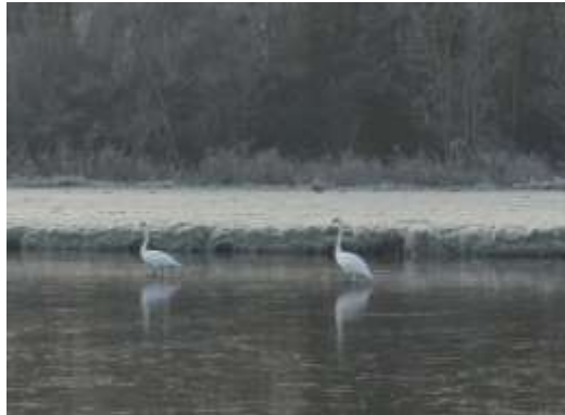
Knobbelzwanen op het ijs

Nog een laatste mooi natuurmomentje Wassergeest. In december bij een van de laatste bezoeken van 2022 was na een pittig koud nachtje de wereld veranderd in een bevroren sprookje. Op de vogelpas is een paar-tje zwaan het ijs aan het controleren of het sterk genoeg is. Dit beeld pak ik nog mooi even mee.