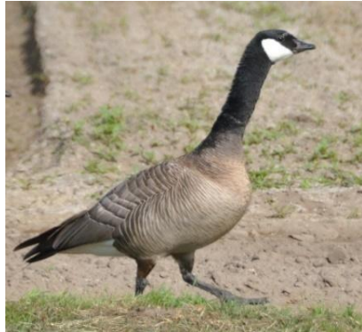
Grote Canadese Gans (Paul Venderbosch)

Maar de poolvos, hoe idioot... is noords. Daarmee Europees Niet pools. Hij zal arctisch zijn En daarmee ook weer Chinees