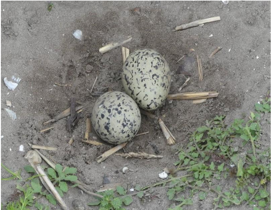
Eieren Scholekster (Sarah Humphrey)

Leuk is dan te horen dat de meer ervaren vogelaars aanwijzingen geven aan de beginners waar men de vogel kan zien. Ja, kijk op de achtergrond zie je die kas en 5 meter links van de kas zie je.... Of op 12 uur een Gele Kwikstaart. Of links van dat witte paaltje. Of hoog in de hemel een zingende Veldleeuwerik: ja iets meer naar mij toe, daar zie je hem. Meestal werd de betreffende vogel ook daadwerkelijk gespot en anders was de vogel volgens de tipgever net weggevlogen. En de kers op de taart, op een mooi met onkruid begroeid rijpad, pulletjes van minstens drie Kievit ouders.