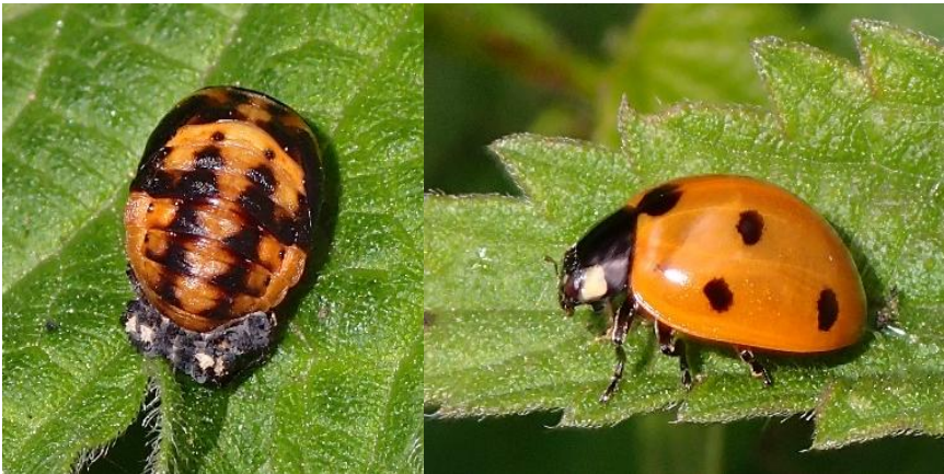
Lieveheersbeestje pop en volwassen (Jan Plomp)