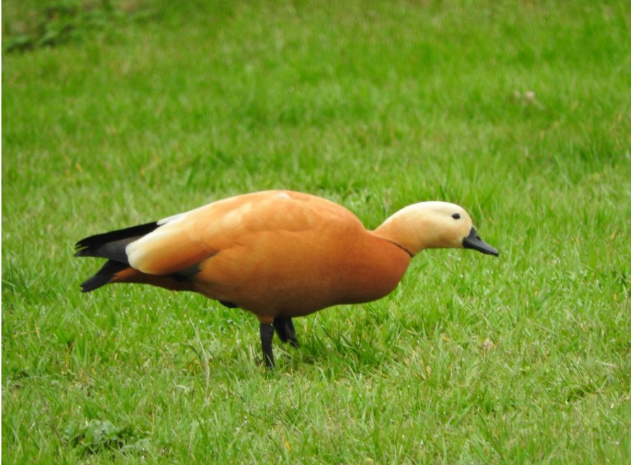
Casarca (Annelies Moolenaar)

Sassenheim (HVS). Tien vogels zijn op 15 juli ter plaatse bij de Klinkenbergerplas (WNL). Een Casarca is op 14 mei ter plaatse in de Vosse- en Weerlanerpolder te Hillegom (WNL).