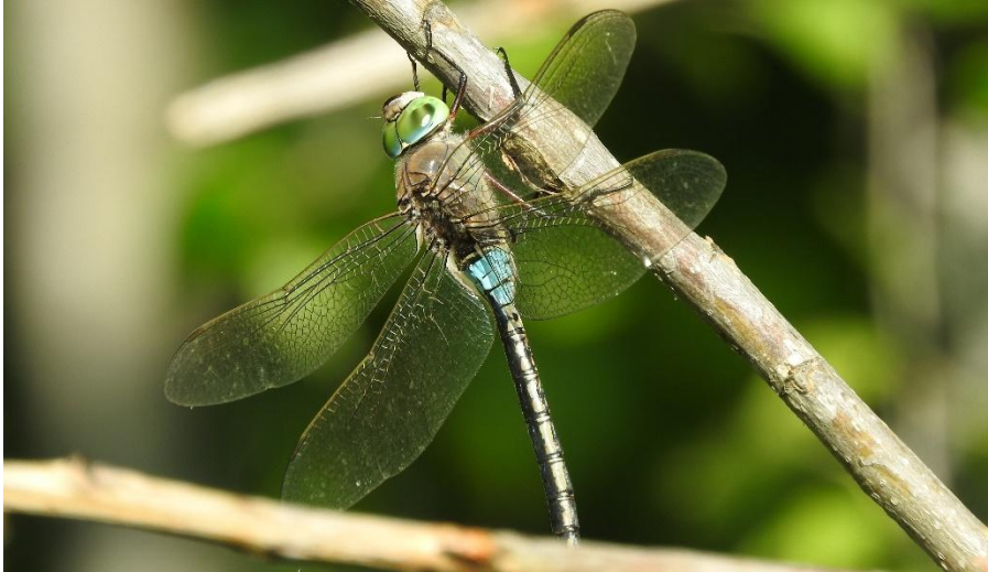
Een Zuidelijke keizerlibel (Annelies Moolenaar)

En twee Heivlinders hingen rond op een zanderig stukje. Dat zijn vrij onopvallende dagvlinders in het duingebied. Ze moeten het vooral van hun mooie vlekjes- en ogenpatroon op de voorvleugels hebben. Een deel van een schild van een Julikever werd gevonden, onmiskenbaar: wit met zwarte vlekken.