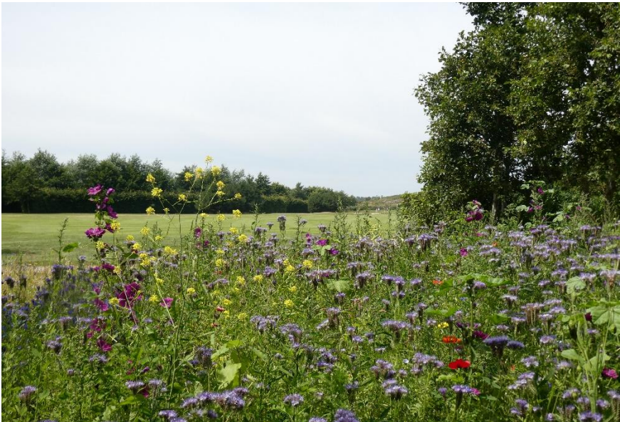
Ingezaaid bloemenperk Tespelduyn (Maud van der Veen)

Langs de waterpartijen zie je een mix van natuurlijke oeverplanten en aanplant. Natuurlijk doen het Riet, de Kleine en Grote lisdodde en de Gele lis het prima. Maar tussendoor vind je ook Waterdrieblad en Moerashyacint, Gevleugeld hertshooi en Harig wilgenroosje. En de Rietorchis was er ook nog volop te vinden.