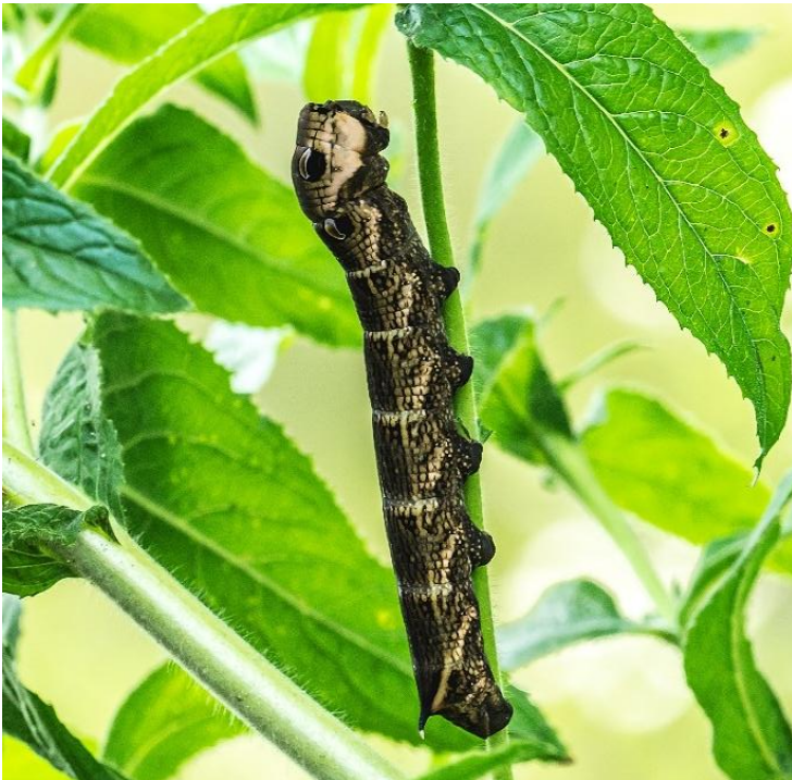
De rups van het Groot avondrood (Riek Bischoff Tulleken)

De allermooiste vondst is door Cees gedaan. De enorme rups van het Groot avondrood, een nachtvlinder, zit in een Harig wilgenroosje. De rups kan wel acht cm groot worden en is een bijzondere verschijning. De rups wordt olifantsrups genoemd en trekt bij verstoring zijn kop iets in en beweegt dan zijn 'nek' heen en weer. Ook de ogenvlekken zijn heel opvallend. De rups foerageert 's nachts maar komt op mooie dagen soms tevoorschijn. Het is dus een geluk dat we 'm gezien hebben. Een andere nachtvlinder die voorbij fladdert, was de Porseleinvlinder. In de Moerasspirea ontdek ik nog een gal van de Moerasspireabladvogelgalmug.