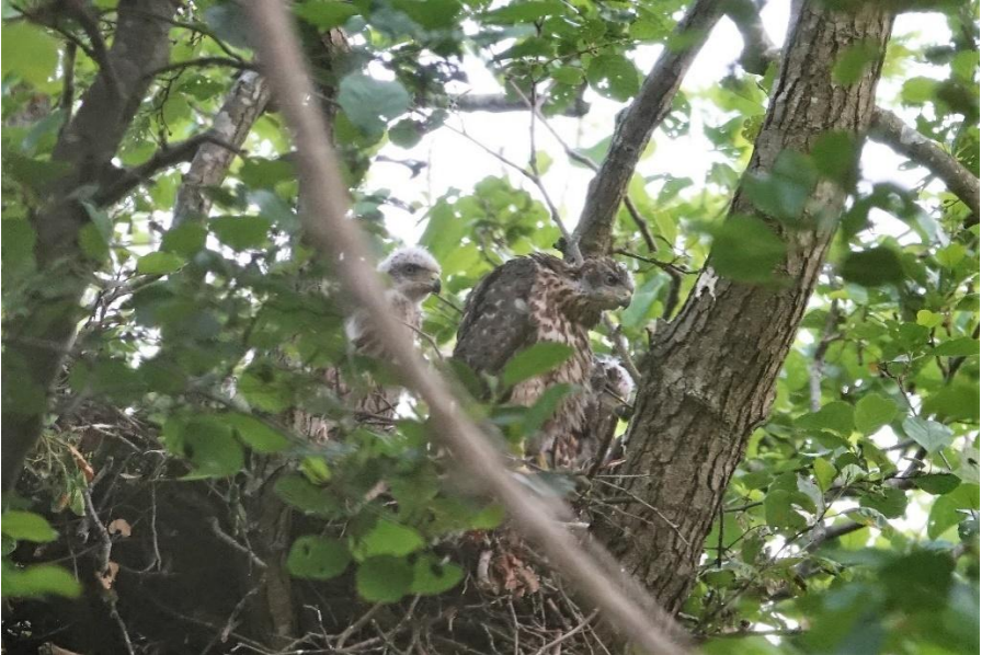
Drie jonge Haviken (Annelies Moolenaar)

een jong had!! Het broedsel in het nest hield zich lange tijd heel stil en pas toen ze groter werden en uit het nest probeerden te komen was de verrassing nog groter toen er drie jongen tevoorschijn kwamen. Onze groep werd er helemaal hyper van. Om de beurt zijn we op gepaste afstand op kraamvisite geweest. De ontwikkeling van het grut werd op de voet gevolgd en de havikskinderen vlogen allemaal uit. Dat is toch een prachtig resultaat.