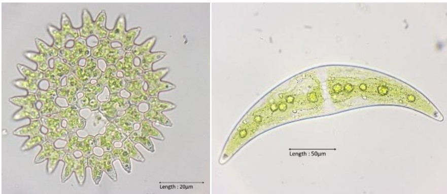
Pediastrum duplex en Closterium Moniliferum