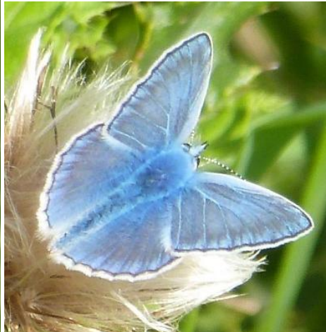
Groot dikkopje en Icarusblauwtje (Maud van der Veen)

Dank iedereen voor hun bijdrage; we vonden het erg leuk om jullie het gebied te laten zien en hopelijk hebben we jullie “aangestoken” om vaker Wassergeest te bezoeken!