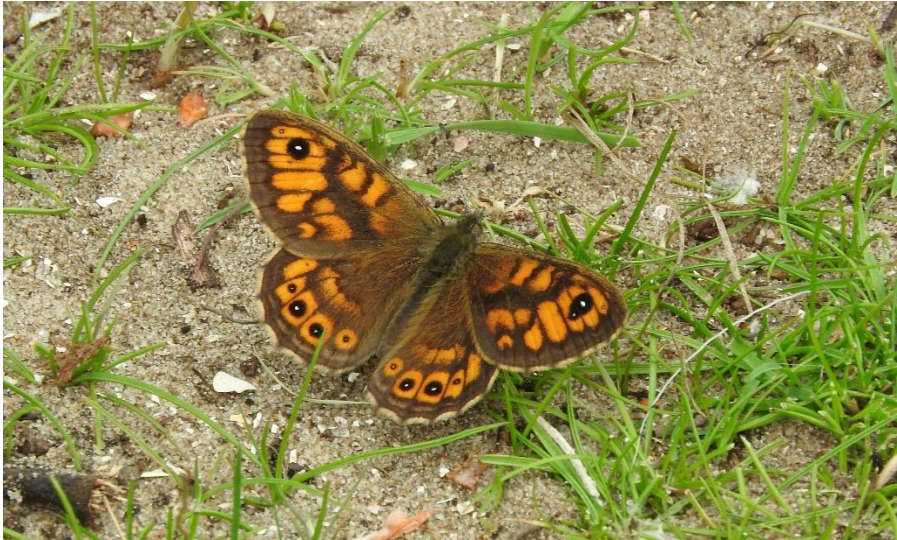
Een Argusvlinder (Annelies Moolenaar)

mezenfamilie, verschillende Boomkruipers en de Boomklever. Even verderop kwam ook nog een Koolmezengezin voorbij.