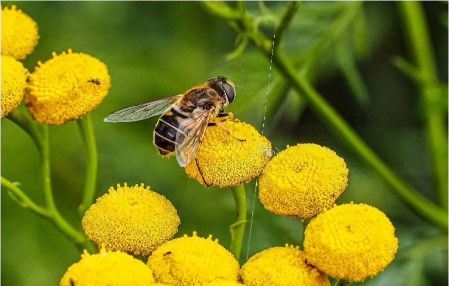
Blinde bij op Boerenwormkruid (Jan Bischoff Tulleken)

Overal zagen we gelukkig insecten rondvliegen, maar het blijft toch moeilijk die op naam te brengen. Dat lukte wel bij de Stadsreus, een erg imposante zweefvlieg, een Groene vleesvlieg en een Blinde bij.