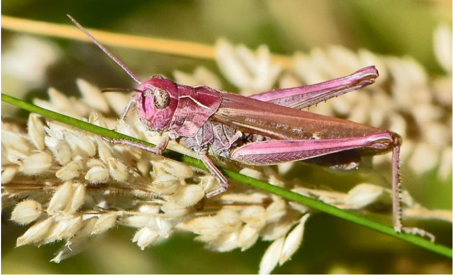
De roze gekleurde sprinkhaan, foto gekanteld

De wildcamera beweest ook z'n nut voor de ongeziene gasten. Naast verschillende soorten muizen (o.a. Rosse woelmuis) en ander klein spul is ook een keer de Boommarter voor de lens geweest. In 2021 is volgens waarneming.nl al eens een Boommarter in Wassergeest gezien. Goed om te weten dat deze nog steeds in dit gebied woont. Een Boommarter jaagt o.a. op muizen en die worden regelmatig door de wildcamera vastgelegd.