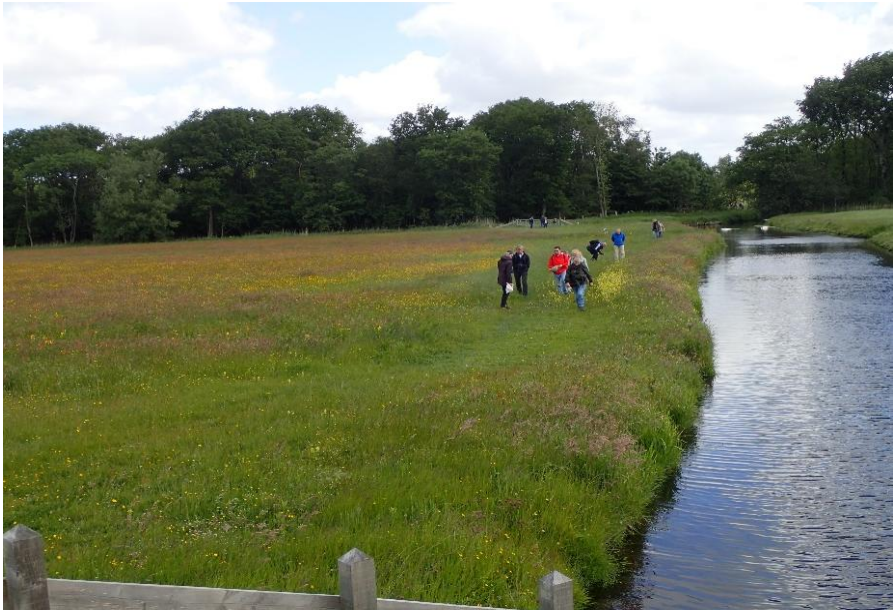
Kruidrijk weiland Wassergeest (Jan Plomp)

verreijkers en fotoestellen gingen we in verschillende groepjes op weg. De meeste kenden het gebied wel van “ooit eens het laarzenpad gelopen” tot “er regelmatig langskomen” of “van horen zeggen”. We liepen langs de randen van de hakhoutbosjes, de oevers van de sloten en langs de volop bloeiende weilanden. Sommige hekken gingen goed open met de sleutel, maar anderen hadden teveel roest, zodat iedereen er overheen moest klimmen. Tijdens het lopen werd veel informatie uitgewisseld over al die verschillende soorten planten, vogels en insecten die we tegen kwamen. Na ruim twee uur werd de wandeling afsloten met een kop koffie en nog wat achtergrond informatie over de boerderij en het gebied.