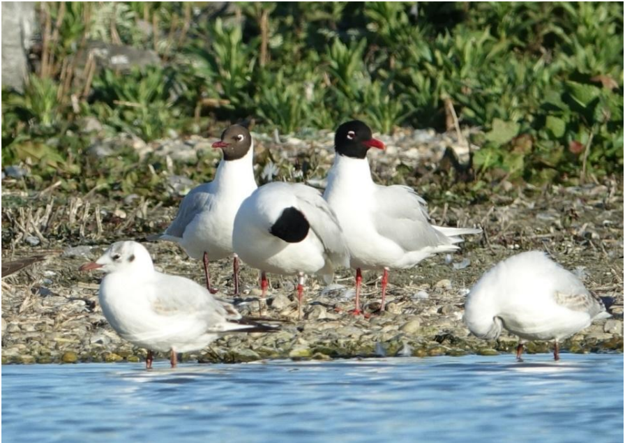
Zwartkopmeeuwen en Kokmeeuwen