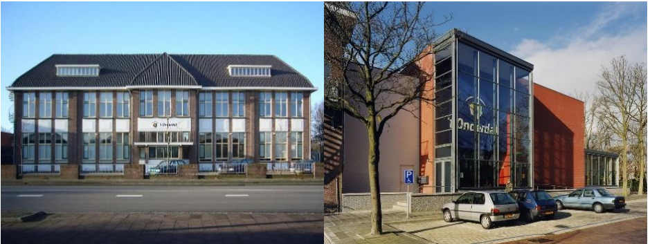
Buitenkant van 't Onderdak in Sassenheim

Nadat we vele jaren gebruik hebben gemaakt van de Klister, het zaaltje van de Gereformeerde Kerk in Lisse, moesten we vanwege de fusie van de Hervormde Gemeente en Gereformeerde Kerk helaas afscheid nemen van dit onderkomen. Gelukkig hebben we een goed alternatief gevonden in Sassenheim: 't Onderdak