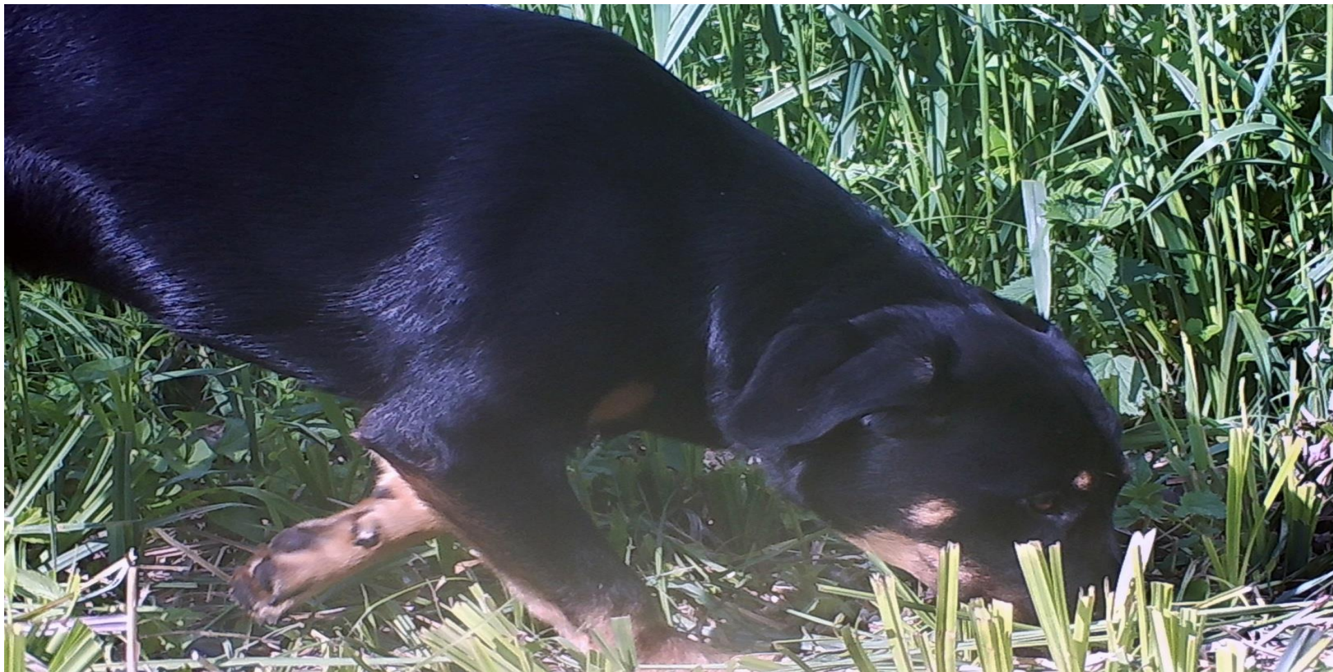
Natuurinventarisatie Wassergeest 2022