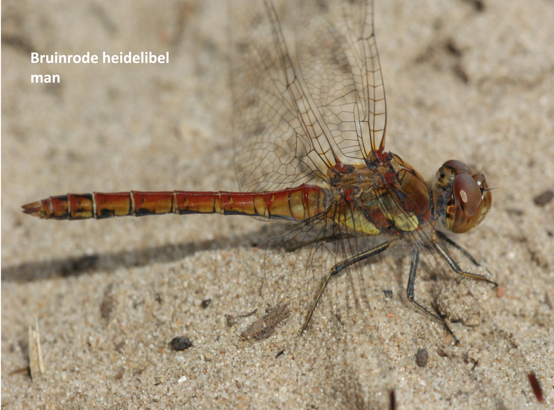
Bruinrode heidelibel man