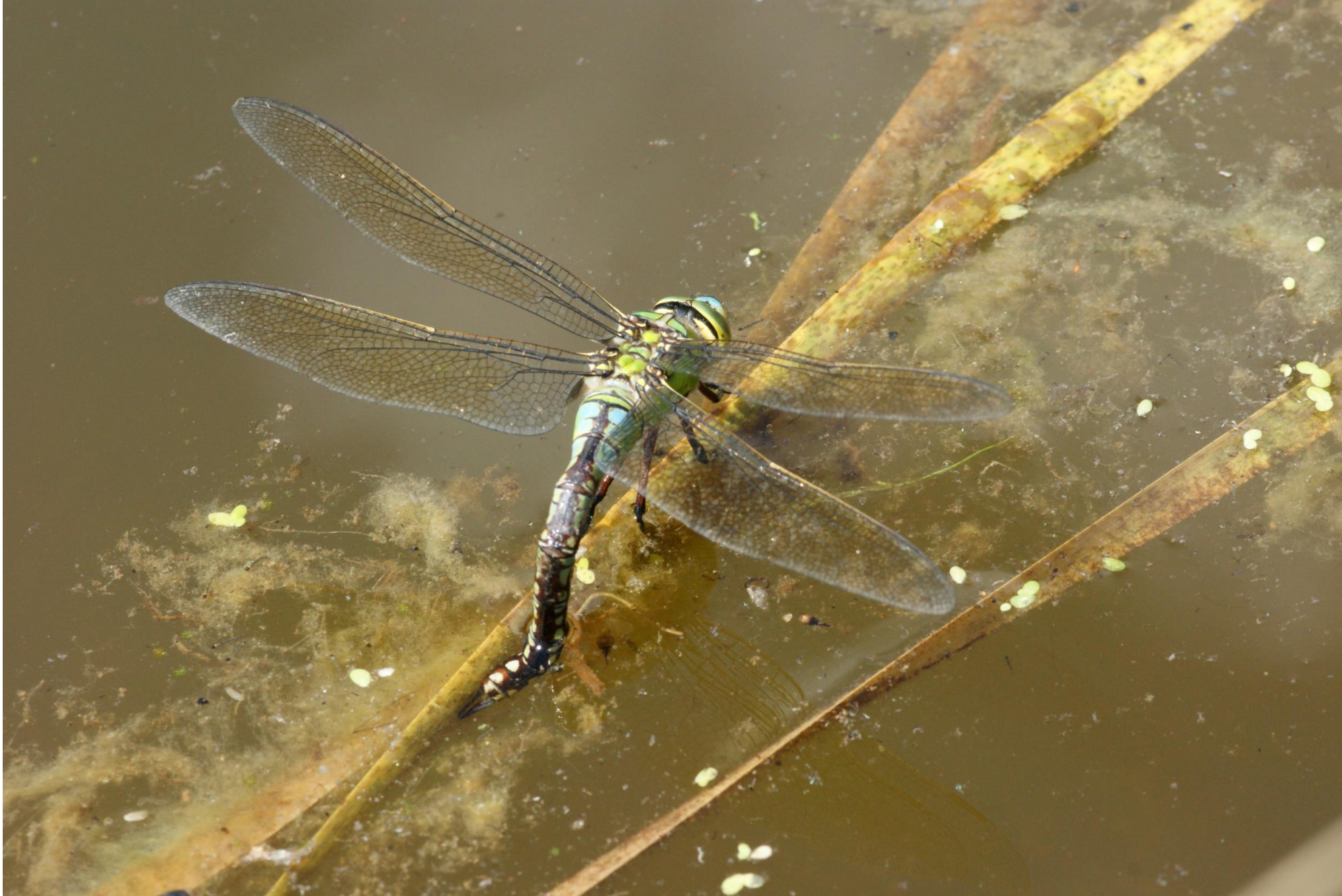
Vrouwtje Grote keizerlibel